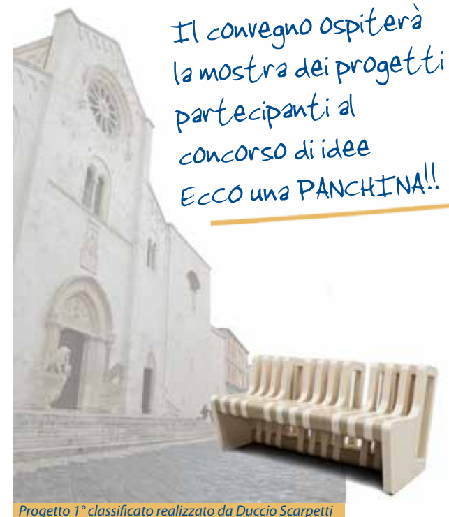
Progetto 1° classificato realizzato da Duccio Scarpetti

Ai partecipanti sarà distribuita una copia della Dichiarazione Ambientale del Comune di Bitetto convalidata dall'ente di certificazione SGS Italia S.p.A.