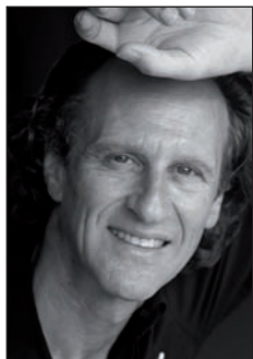
Arch. Matteo Thun

Matteo Thun, 57 anni, architetto e designer, nato a Bolzano, ha studiato presso l'Accademia di Salisburgo e l'Università di Firenze con Oskar Kokoschka. Dopo l'incontro con Ettore Sottsass diventa co-fondatore del gruppo Memphis a Milano; qui apre il proprio studio nel 1984. Matteo Thun & Partners lavora negli ambiti dell'architettura e del design. La sostenibilità economica, ecologica, socioculturale è la costante progettuale dello studio Matteo Thun & Partners.